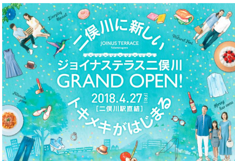
「ジョイナス テラス二俣川」 グランドオープンイメージビジュアル

*「ジョイナス テラス2」2階のみ2018年(平成30年)秋のオープンを予定しています。