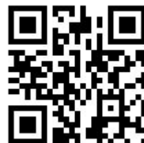
「ジョイナス テラス二俣川」 公式ウェブサイト