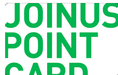
ジョイナスポイントカード （イメージ）

入会金、年会費無料。「相鉄ジョイナス」、「ジョイナス テラス二俣川」、「二俣川相鉄ライフ」でのお買い上げ金額100円（税抜き）ごとに1ポイントが貯まります。貯まったポイントは各施設の加盟店舗にて500ポイント単位で、商品ならびにサービス代金の一部または全部としてご利用できます。 ※一部対象外商品および店舗がございます。