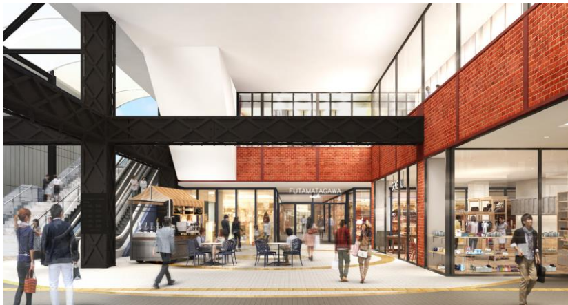
JOINUS TERRACE二俣川第2期エリア(イメージ)